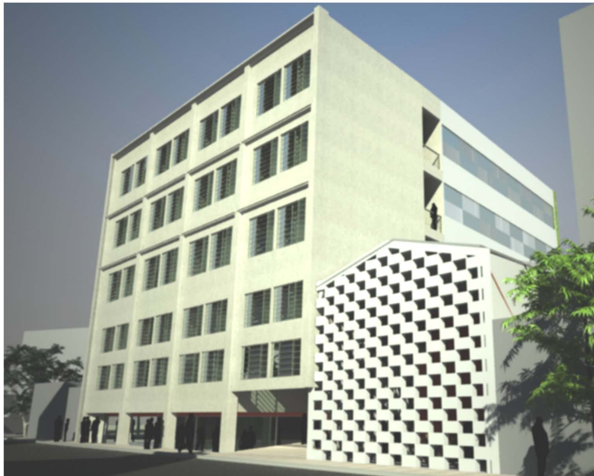
Proposta para requalificação do edifício localizado à rua da Gamboa